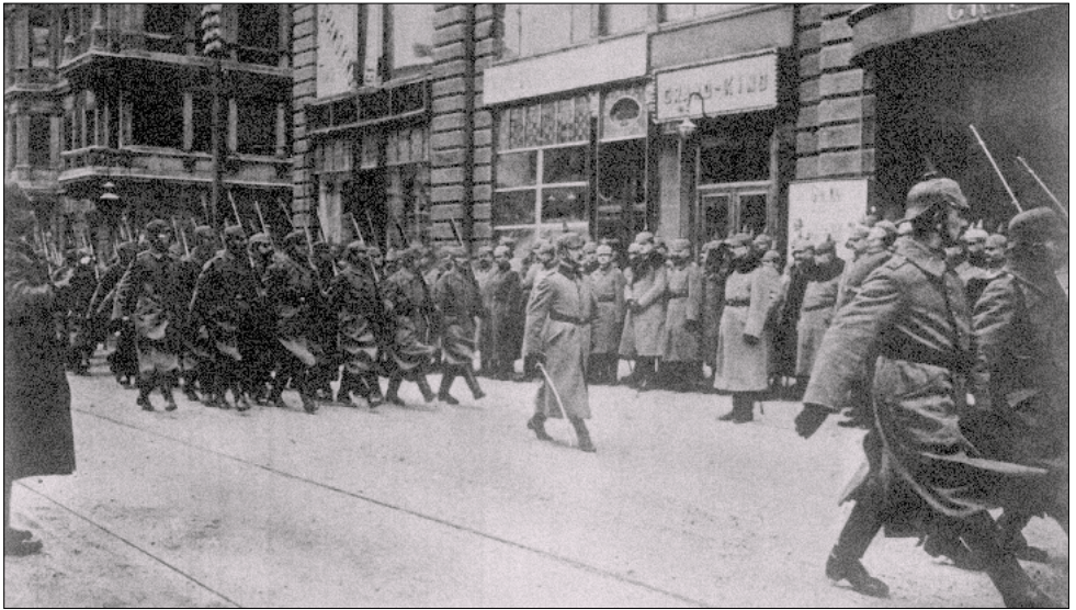
Ryc. 2. Wojska niemieckie na ul. Piotrkowskiej