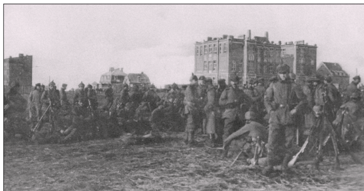
Ryc. 4. Odpoczynek oddziałów niemieckich pod Łodzią