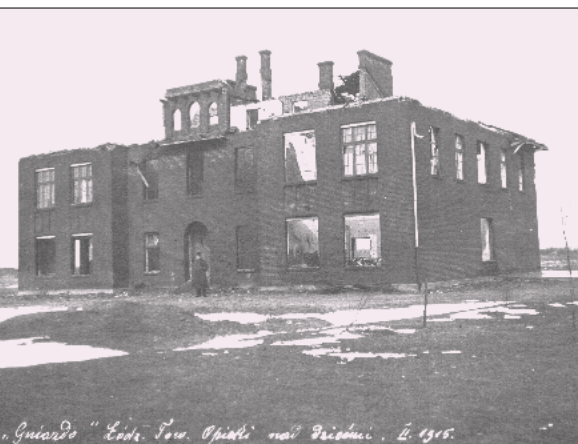
Ryc. 1. Zniszczenia wojenne w Łodzi. Zrujnowana siedziba Towarzystwa Opieki nad Dziećmi

Porządku pilnowała Milicja Obywatelska 3 . Sytuacja przez wiele tygodni była niepewna – Łódź zajmowana była na przemian przez wojska rosyjskie i niemieckie, by 6 grudnia 1914 r., po rozegranej na przełomie listopada i grudnia bitwie łódzkiej, znaleźć się ostatecznie pod okupacją niemiecką (ryc. 1–3).