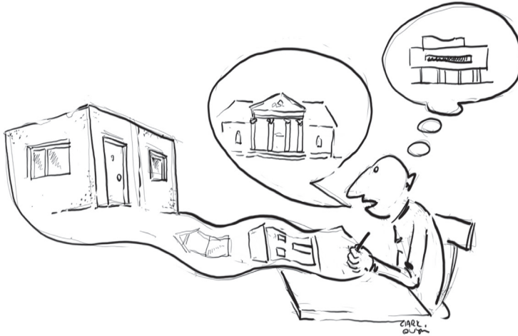
1. „Słowo architekta” (rys. Błażej Ciarkowski)

upadku komunizmu 9 . Słowo architekta wchodzi w empatyczną relację z „obrazem pobitego przodka” – kłopotliwego dziedzictwa architektury PRL-u, poszukując w jego krytycznej analizie wartości poznawczych dla terażniejszości.