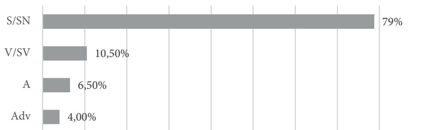
FIGURA 3. Categoría gramatical de los términos en las LACSP-FP (español europeo)

Dentro de los esquemas encabezados por preposiciones se observan, además, otras diferencias, relacionadas con la naturaleza gramatical de los términos de esos sintagmas preposicionales. Con más frecuencia, ese lugar lo ocupan nombres o sintagmas nominales (78,8%). Otras categorías gramaticales son mucho menos frecuentes y son las siguientes: adjetivos (6,5%), verbos o sintagmas verbales (10,5%) y adverbios (4,2%).