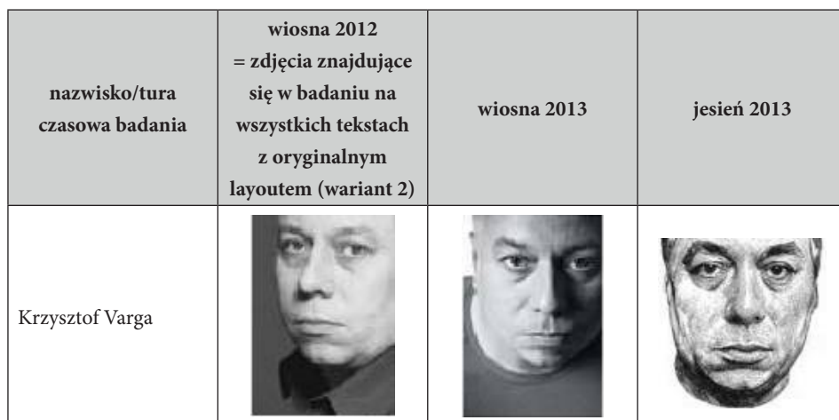
Tabela 6. Zdjęcia dołączane przez redakcje do felietonów w tekstach, które pojawiły się w badaniu

W drugiej i trzeciej turze czasowej, w przypadku większości felietonistów, zaistniała konieczność zamiany zdjęcia towarzyszącego tekstowi na to, które pojawiło się w pierwszej turze (wiosna 2012, zob. tabela 6). O ile bowiem trudno mówić o wpływie kroju pisma na image autora tekstu, o tyle ma znaczenie charakter fotografii publicysty. Dowiedziono, że zmiana wyrazu twarzy może determinować odmienną konstrukcję wizerunku felietonisty (zob. Barańska 2012). Jak pokazuje tabela 6, w trakcie badania redakcje posługiwały się odmiennymi podobiznami autorów. Niejednokrotnie, w poszczególnych turach czasowych badania, oryginalnie tekstom towarzyszyły różne fotografie. Podążanie za zmianami wydawców oznaczałoby brak możliwości porównania wyników między turami albo zniekształcenie rezultatów i zaburzenie ich rzetelności. W jednym z przypadków (Krzysztof Varga) podobizna przedstawiona była nawet w innej technice (nie zdjęcie, ale ołówkowy szkic). W tych warunkach zdecydowano się na zachowanie tej samej fotografii, dzięki czemu każdy respondent czytający tekst autora o jawnej tożsamości w każdej z tur czasowych widział dokładnie to samo zdjęcie publicysty (towarzyszące pierwotnie felietonom publikowanym wiosną 2012). Zadbano w ten sposób o rzetelność wyników oraz ich porównywalność.