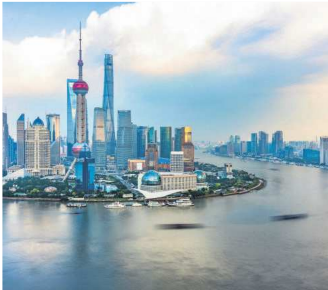
Otwarcie w latach 90. XX w. Szanghaju na świat było kolejnym bodźcem modernizacji Chin

Chiny pod rządami Mao politycznie kierowały się do wewnątrz. Strategia gospodarki zorientowanej na eksport przynosiła dotychczas spektakularne sukcesy. Są też niezbędne zjawiska: jednym z czynników ekonomicznych, który podsycał miejskie protesty w latach 1988-1989, był gwałtowny wzrost stopy inflacji, poważnie zmniejszający siłę nabywczą pracowników instytucji i firm państwowych (jeśli wówczas sytuacja wy-