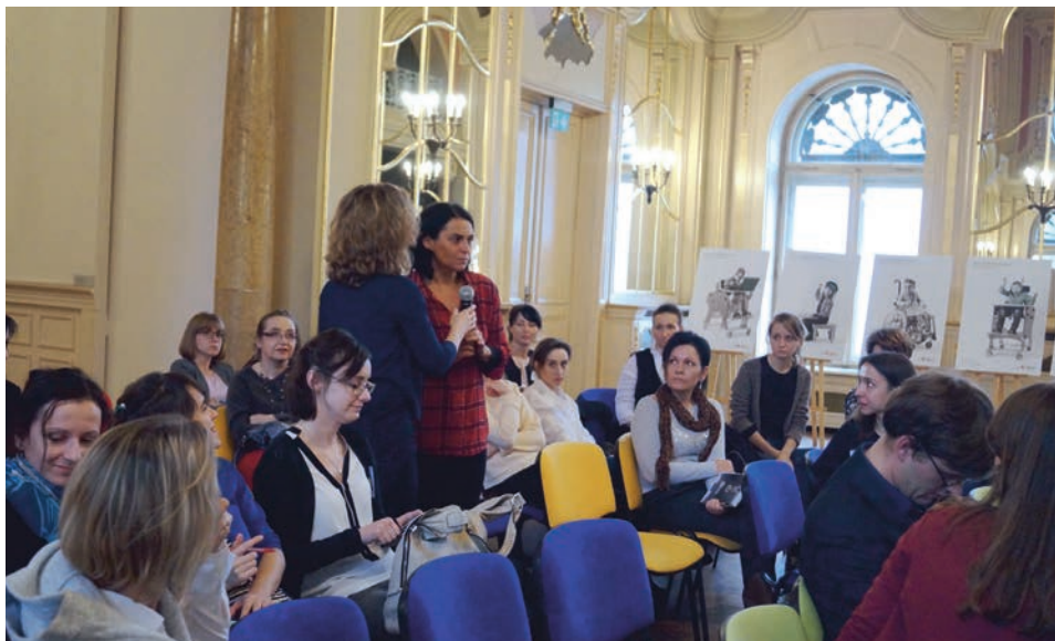
Ryc. 4. Dyskusje warsztatowe z udziałem osób z niepełnosprawnością podczas konferencji Niepełnosprawni i sztuka , Łódź 2017, fot. A. Drozdowski